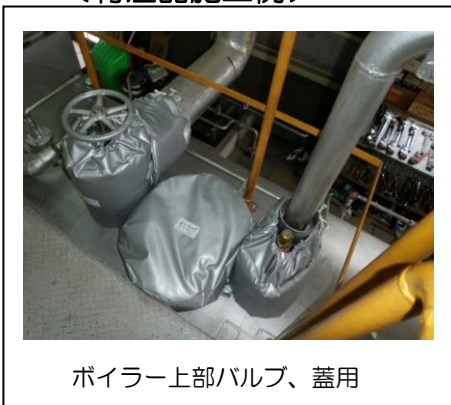
ボイラー上部バルブ、蓋用