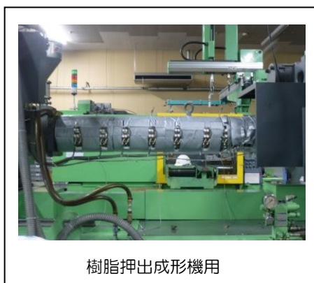
樹脂押出成形機用